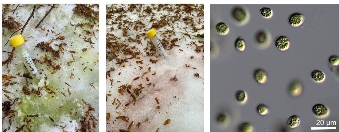
図 雪を染める雪氷藻類の繁殖（左）緑雪（中央）赤雪（右）緑雪の正体である雪氷藻類

DOI： https://doi.org/10.3389/fmicb.2023.1201230